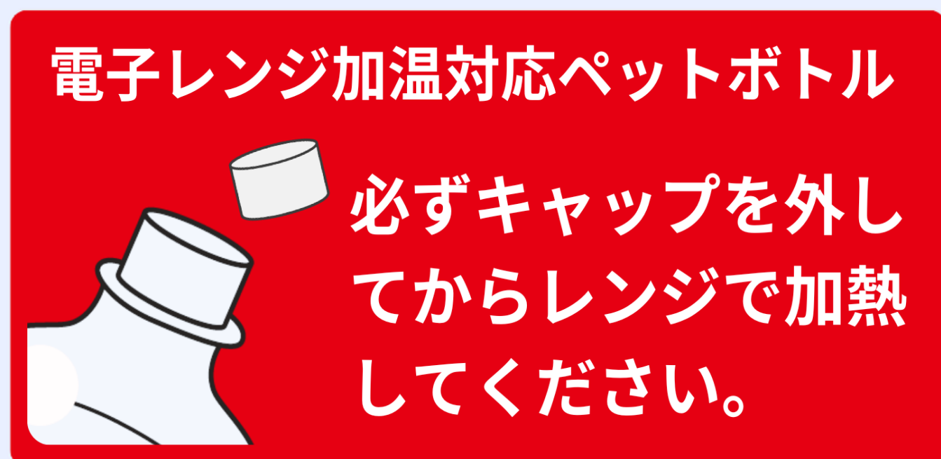
↑電子レンジ加熱対応ペットボトルの例