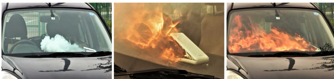
モバイルバッテリー 車内に放置して発火 (再現映像)

https://jaf.or.jp/common/safety-drive/car-learning/user-test/temperature/summer