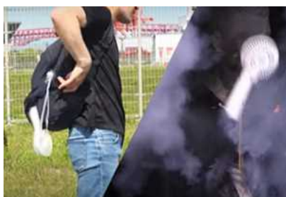
携帯用扇風機の破裂