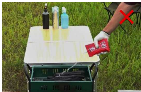
着火剤の継ぎ足し

既に火が点いている炭に着火剤を継ぎ足した場合、大きな炎が上がり、やけどや火災に至る場合があります。絶対に着火剤の継ぎ足しはしないでください。特に炎天下では着火剤の炎が見えにくいいため、気づいたときには重傷になることがあります。