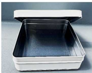
保管容器の例(イメージ)

また、上記のような異常が発生した場合は、発火、破裂などの事故に備え、携帯用扇風機を金属製の缶などの保管容器に入れて保管することが望まれます。