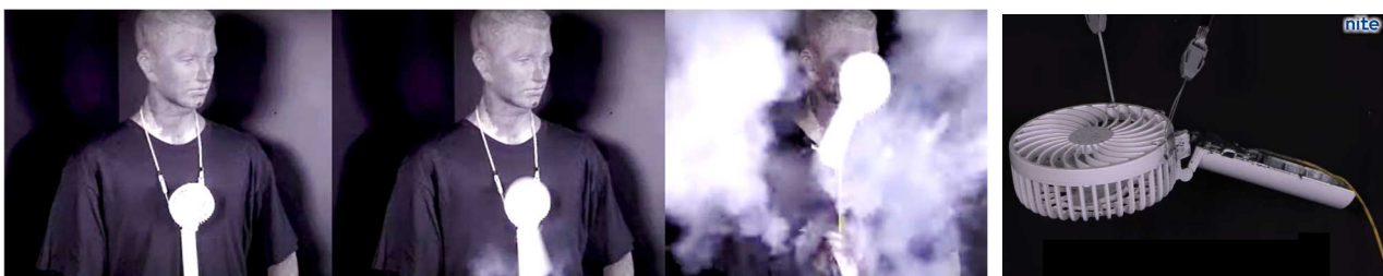
(再現映像) 破損してそのまま使っていると