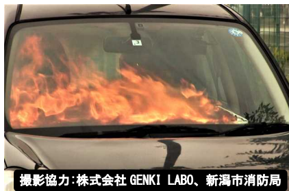
モバイルバッテリー車内で発火

これから夏本番を迎える前に、製品事故による思わぬ被害を未然に防ぐため、事故防止のポイントを確認しましょう。