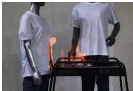
やけどや火災の危険性

危険な着火剤の継ぎ足しをしたことのある人は、炭・薪でのバーベキュー経験者では3割を超えるとの調査結果 (※3) もあります。