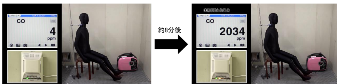
図 2 室内で携帯発電機を使用した際の一酸化炭素中毒

当該製品に異常は認められず、換気が十分に行えない屋内で使用したため、排気ガスにより屋内の一酸化炭素濃度が上昇し、一酸化炭素中毒になったものと推定される。なお、本体及び取扱説明書には、「排気ガス中毒のおそれあり。」、「屋内など換気の悪い場所で使用しない。」旨、記載されている。