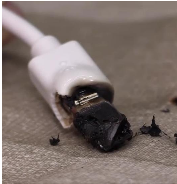
図5 焼損した充電ケーブルのコネクターのイメージ