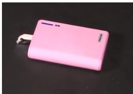
図4 モバイルバッテリーのイメージ

一方で、一定数の事故(火災)が毎年発生していますので、以下の注意点に従って、安全にご利用ください。