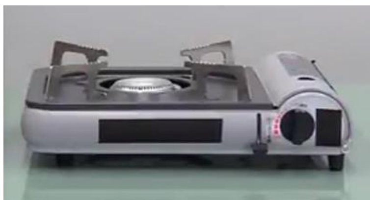
図 3 カセットこんろのイメージ

しかし、カセットこんろの誤使用は、ボンベの破裂による火災など重大な事故につながる可能性があります。以下の注意点に従って、安全にご利用ください。