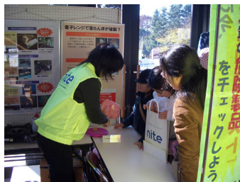
熱心に説明に聞き入る来場者の方々