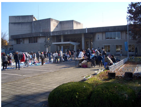
会場の真岡市民会館

用意した配布物は、最近の製品事故に関する報道などを反映してか、午前中に配布完了となってしまう状態であった。今回が2回目の出展であったが、NITEの製品安全業務が市民の方々の安全に大いに役立っていることを感じた出展であった。