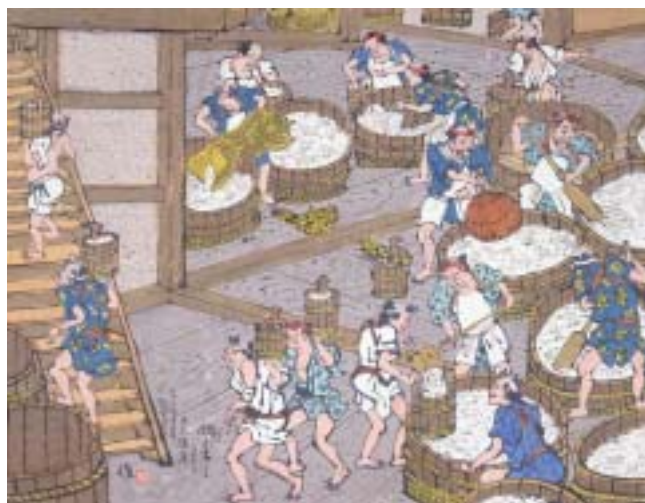
酒、醤油、酢、味噌づくりに麹菌は欠かせない 江戸時代の酒づくり

独立行政法人 産業技術総合研究所(以下「産総研」という) 生物機能工学研究部門 遺伝子応用技術研究グループ、生命情報科学研究センター 数理モデルチームは、麹菌ゲノム解析コンソーシアムを組織し、独立行政法人 製品評価技術基盤機構(以下「NITE」という)との共同研究によって、世界で初めて麹菌のゲノム塩基配列の解析に成功した。麹菌ゲノム解析コンソーシアムは、財団法人醸造協会を代表とし、産総研、酒類総合研究所、食品総合研究所、東京大学、東京農工大学、東北大学、名古屋大学、アクシオヘリックス、天野エンザイム、インテック W&G、大関、キッコーマン、協和発酵工業、月桂冠、ヒゲタ醤油からなる。この研究では、麹菌のゲノム塩基配列に基づいて、遺伝子の予測、他の近縁種のカビとのゲノム構造の比較などを行うことにより、麹菌が高い発酵生産能力を持つことが裏付けられた。